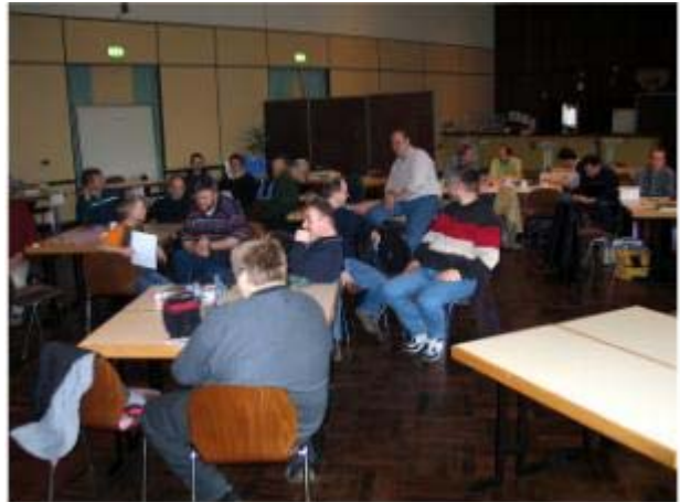
IMM 160